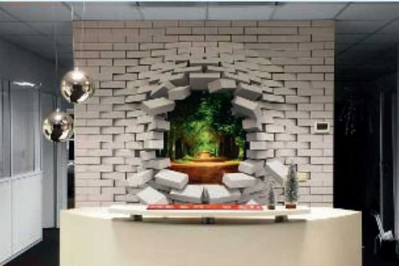
Deze wandvisual, ook een sticker, is het eerste dat je ziet als je binnenloopt bij de StickerCompany in Eindhoven.

liet ik op vrijdag tegen betaling eigen stickers drukken, die ik doorverkocht aan vrienden en bekenden. Dat werd een handeltje.' Al op heel jonge leeftijd startte hij zijn eigen drukkerij, in de garage van het ouderlijke huis. 'Direct na school werkte ik in ploegendienst bij Brabantpers, hield tijd over en startte in mijn vrije uren een eigen stickerdrukkerij.'