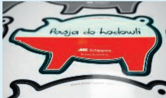
Magneetstickers in vorm gesneden.

gen. 'Ik ben nu op zoek naar een heldere folie die op een bepaalde manier in een touchscreen wordt verwerkt met dezelfde dikte, lijm, stijfheid en prijsniveau. De vorige leverancier stopte er mee.'